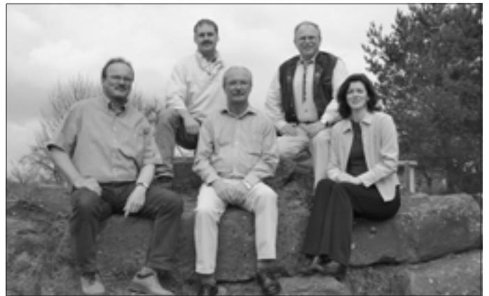
Kandidaten der Freien Wähler Holzbronn besuchen Holzma

In unserem kleinen Stadtteil Holzbronn ist einer der größten Gewerbesteuerzahler der Stadt Calw angesiedelt. Dies ist Grund genug dafür, dass die Kandidaten der Freien Wähler Calw initiiert durch die Holzbronner Freien Wähler-Kandidaten am 4. Mai um 14.30 Uhr sich zu einer Besichtigung in der Firma Holzma treffen. Alle Kandidaten der Freien Wähler sind dazu herzlich eingeladen.