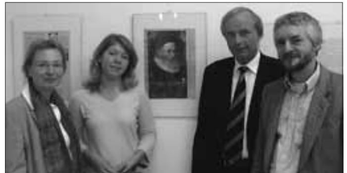
Talk-Gottesdienst über Johann Valentin Andrea und Ausstellungseröffnung. Den Mitwirkenden ein herzliches Dankeschön!

Am Samstag, 2.10. können ab 9 Uhr die Erntegaben in der Kirche abgegeben werden, um den Erntedankaltar zu gestalten.