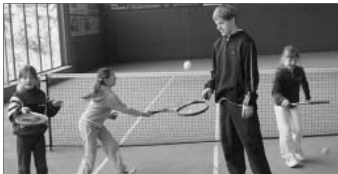
Wintertraining in der Halle

Auch wenn sich unsere Spiel-Aktivitäten im Moment auf die Halle beschränken, es kann nicht mehr lange dauern bis es auch draußen weiter geht.