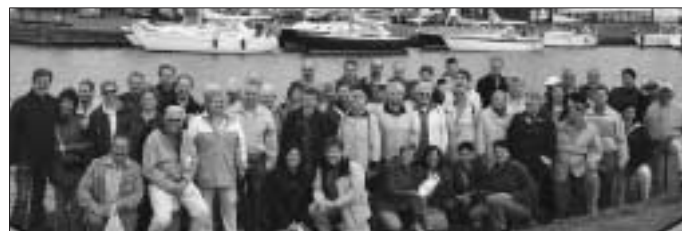
Unsere Chorreise nach Amsterdam vom 20. bis 22.5.: Die gesamte Reisegruppe im Hafen von Marken am Jisselmeer

Nächste Chorproben: Gemischter Chor am Dienstag, 21.6. 20 Uhr Männerchor heute, Freitag, 17.6., 20 Uhr