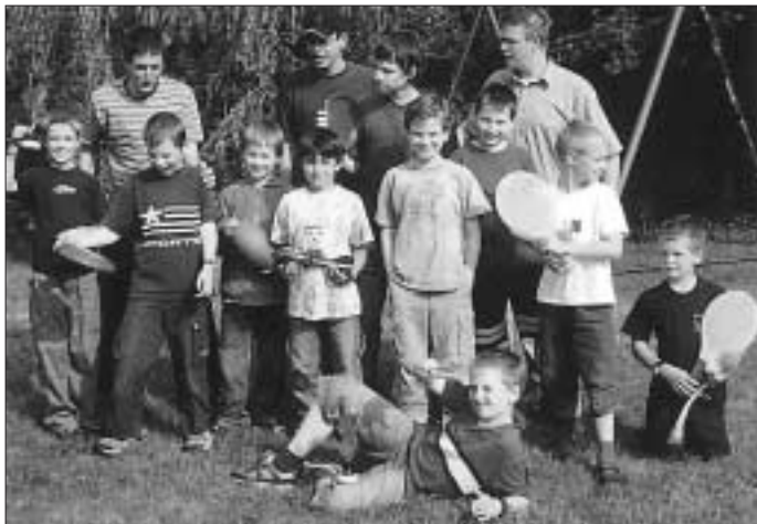
Wir Kinder der Kinderkirche und der Jungscharen bedanken uns ganz herzlich bei den Organisatorinnen und Veranstaltern des Adventskalenderwegs. Von einem Teil des Erlöses wurden Spielgeräte angeschafft, mit denen wir jetzt im Sommer bestimmt viel Spaß haben werden.