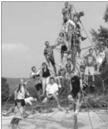
Tennisspieler können nicht nur Fahrrad fahren...

Eine kleine Bildnachlese zur Radausfahrt der Tennisfreunde am 3. September. Die Tour führte uns über Deckenpfronn, Gärtringen, Dachtel und Gechingen zum Abschluss-Wurstsalat im Tennisheim. 22 Kinder und Erwachsene waren dabei - und wie man sehen kann, alle waren bestens gelaunt!