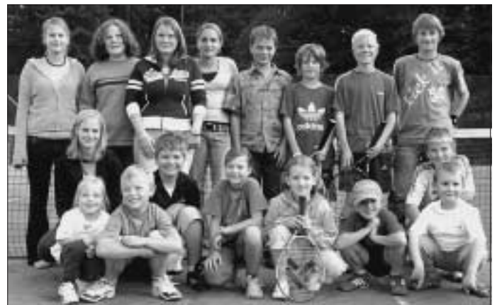
Die Teilnehmer der diesjährigen Jugendmeisterschaften

Bei bestem Wetter absolvierten unsere Jugendlichen letztes Wochenende die Jugendmeisterschaften 2005. Es wurde häufig großartiges Tennis geboten, die Spiele waren spannend und hart, aber immer von sportlicher Fairness gekennzeichnet.