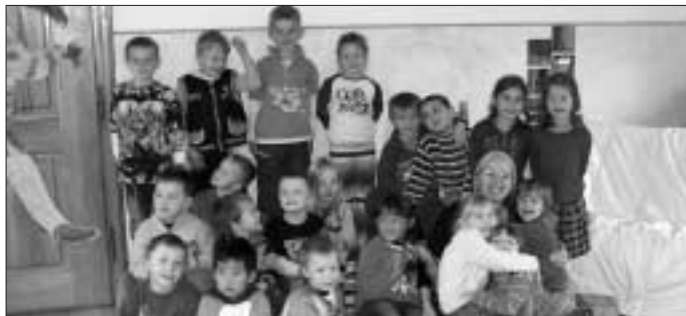
Vor und nach dem Erntedankfest findet und fand wieder ein Erzählabschnitt zur Schöpfungsgeschichte statt.

Der Kooperationsschwerpunkt bei dem Projekt "biblisches Erzählen im Kindergarten" ist das Vermitteln und Vertiefen christlichen Basiswissens. Dies geschieht durch Erzählen, gemeinsames Singen und bildnerisches Gestalten. Unter anderem stand die Besichtigung der Marienkapelle im Kloster Hirsau auf dem Programm. Sehr viel Freude bereitet den Kindern das Singen mit Gitarrenbegleitung und auch das Herstellen eines eigenen Heftes mit selbst gemalten Bildern zu den Inhalten der biblischen Geschichten. Dass die Kinder viel Spaß bei dem Projekt haben, zeigt schon ihre Vorfreude bei der Ankündigung: "Heute ist wieder Erzähltag."