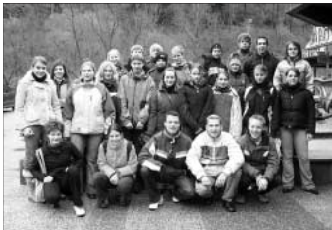
Die Teilnehmer hatten beim Schlittschuhlaufen ihren Spaß.

Am 4. Advent, 18.12. umrahmt die Trachtenkapelle den Gottesdienst in der Stammheimer Martinskirche.