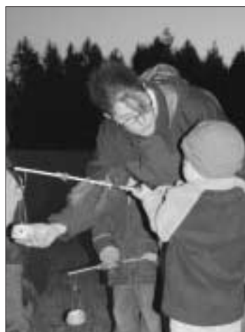
Mit getonten Laternen durch den nächtlichen Wald

Am Freitag war es dann endlich soweit: gegen 16 Uhr kamen alle Wurzelkinder mit ihren Familien, um das Drachen- und Lichterfest zu feiern. Nach einer kurzen Begrüßungsrunde in Form eines afrikanischen Liedes, welches für gutes Wetter sorgt, holten die Kinder eifrig ihre selbstgefertigten Drachen, um sie endlich steigen zu lassen! Das afrikanische Lied belohnte alle mit strahlendem Sonnenschein, nur der "ach so wichtige Wind", der blieb leider aus... So liefen die Kinder die Wiese hinab, bei den Vätern und Müttern entbrannte ebenfalls der Ehrgeiz, bis der ein oder andere Drache tatsächlich gen Himmel stieg.