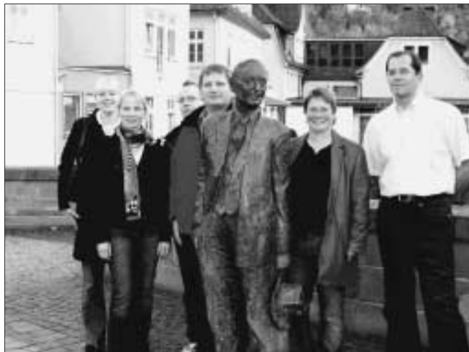
Internationale Gäste auf der Nikolausbrücke

Die Klasse 9b des HHG bereitete den Gästen einen herzlichen Empfang und löcherte die Lehrer mit Fragen. Nun geht es an die Arbeit. Im Juni 2007 soll das gemeinsame Buch mit spannenden Geschichten und Mythen aus der jeweiligen Heimatstadt in Polen der Öffentlichkeit vorgestellt werden.