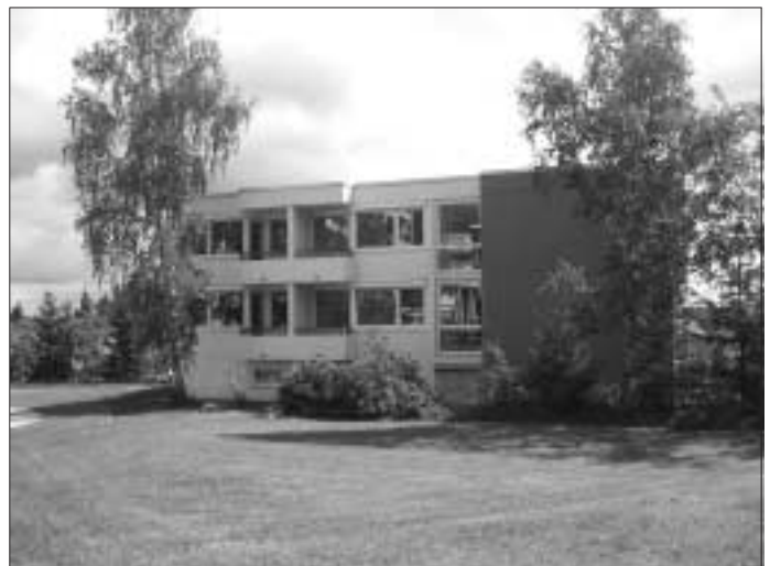
Das komplett sanierte Gebäude für Betreutes Wohnen auf dem Wimberg

Alle Wohnungen sind zwischenzeitlich vermietet und bezogen. Im Erdgeschoss des Gebäudes befinden sich eine Arzt- und eine Krankengymnastikpraxis, die ebenfalls teilweise saniert wurden. Die pflegerische Betreuung der Bewohner übernimmt die Sozialstation der Diakonie. Das Notrufsystem kommt vom Deutschen Roten Kreuz, das bei eingehenden Notrufen durch die Rettungsleitstelle die jeweils erforderliche Hilfe vermittelt.