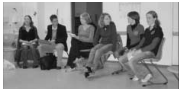
Geschäftsleitung von HHGRuendet