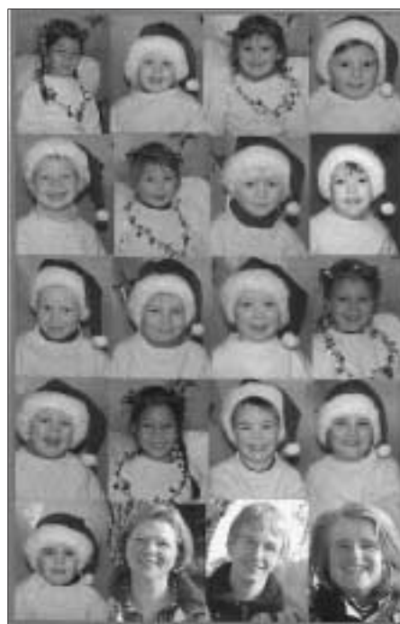
Die Wurzelkinder und die Erzieher wünschen schöne Weihnachten

Die Wurzelkinder feiern nämlich gemäß dem Jahresthema eine rituelle indianische Weihnacht. In der Adventszeit wurde das traditionelle Weihnachtsfest immer wieder mit der indianischen verglichen, sodass beide Feste