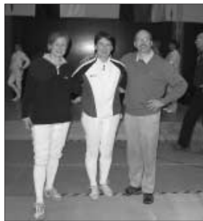
Bei den deutschen Meisterschaften 2006

Ein Krimi konnte nicht spannender sein für die Zuschauer bei den Deutschen Senioren-Meisterschaften in Bad Dürkheim.