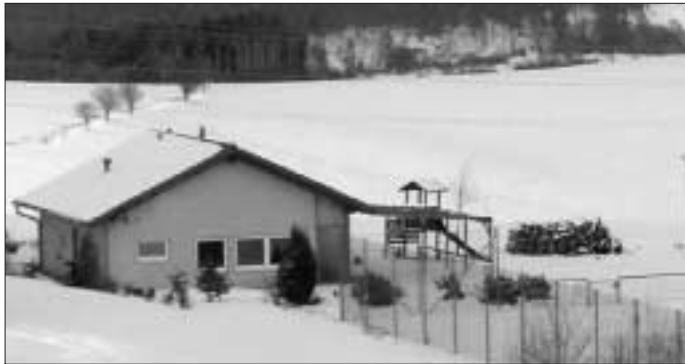
Das Holz wird wohl reichen

Im Sommer kann jeder grillen - wir starten unser 1. Wintergrillfest am 18. Februar ab 18 Uhr! Alle, alle sind herzlich eingeladen - sicher auch ein spaßiger Anlass für die jüngeren Tennisfreunde. Ein großes Feuer sorgt für Wärme von außen, Glühwein und Kinderpunsch wärmen dann von innen, zum Essen gibt's Rote Würste und Brot, wer etwas anderes will, darf gerne was mitbringen.....!