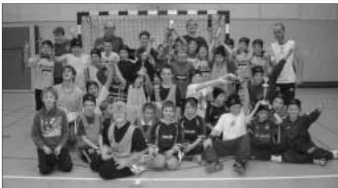
Sieger wurde Wimberg United vor den Alzenberg Rangers.

Viel Spaß hatten unsere E- und D-Jugend beim vorweihnachtlichen 1. Christmas Sower Allstars Cup in der Stadthalle.