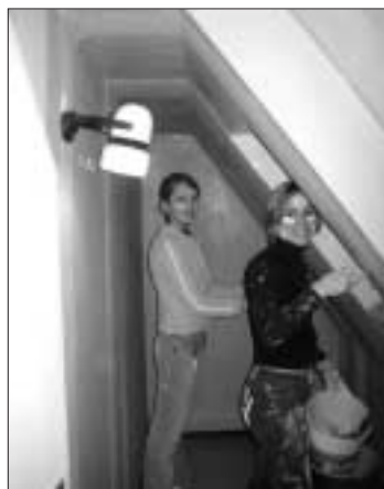
Mit vollem Einsatz dabei

Die Schönheitsreparaturen der Innenräume wurden von den Besuchern des Stundenhäusle ausgeführt. Dabei gingen sie mit vielen Ideen und großem Engagement zu Werke. Da die Arbeiten nun beendet sind, möchten wir Ihnen die Möglichkeit geben, sich selbst einen Eindruck vom neuen Stundenhäusle zu verschaffen. Deshalb laden wir Sie zum Tag der offenen Tür am