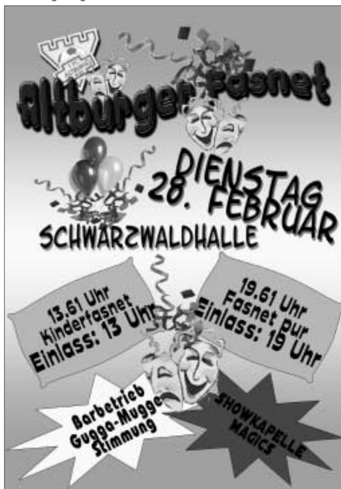
Fasnet in Altburg

Zum traditionellen Fasnets-Ausklang lädt der FC Altburg am Faschingsdienstag, 28.2.2006 recht herzlich in die Schwarzwaldhalle in Altburg ein. Für beste Stimmung und das leibliche Wohl ist reichlich gesorgt.