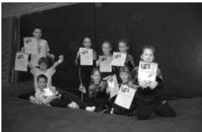
Teilnehmer Fitness-Cup und Talent-Cup

Bei den ersten Wettkämpfen im Jahr 2006, dem Fitness-Cup und dem Talent-Cup, erzielten die Altburger sehr gute Ergebnisse. An den Wettkämpfen, die am Samstag den 18.02. in Straubenhardt ausgerichtet wurden, nahmen 13 Turnerinnen und Turner vom TV Altburg teil. Die Kinder aus der Nachwuchsgruppe traten beim Fitness-Cup an, bei dem Schnelligkeit, Kraft, Beweglichkeit und Koordinationsfähigkeit geprüft wurden. Für die Älteren stand der Talent-Cup auf dem Programm: An 16 Stationen mussten Grundlagenübungen aus dem Gerätturnen vorgeführt werden, wobei die Kampfrichter sehr viel Wert auf Haltung und saubere Ausführung der einzelnen Übungen legten.