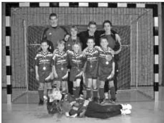
Turniersieger beim Turnier des FV Calw: FCIAW F-Jugend