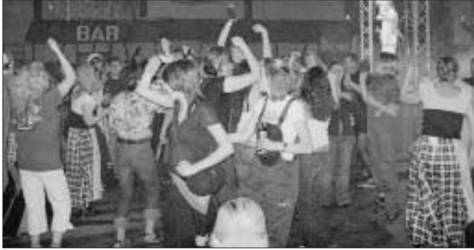
Alle Tanzfreudigen stürmten beim Faschingshit "Cowboy und Indianer" die Tanzfläche.

Der Musikverein Stammheim möchte sich an dieser Stelle bei allen Besuchern des Stammheimer Faschings für zahlreiches Kommen bedanken. Wir hoffen, Sie auch beim nächsten Mal begrüßen zu dürfen!