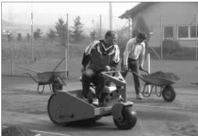
Kleine Unterschiede: Chef und Hiwi ...