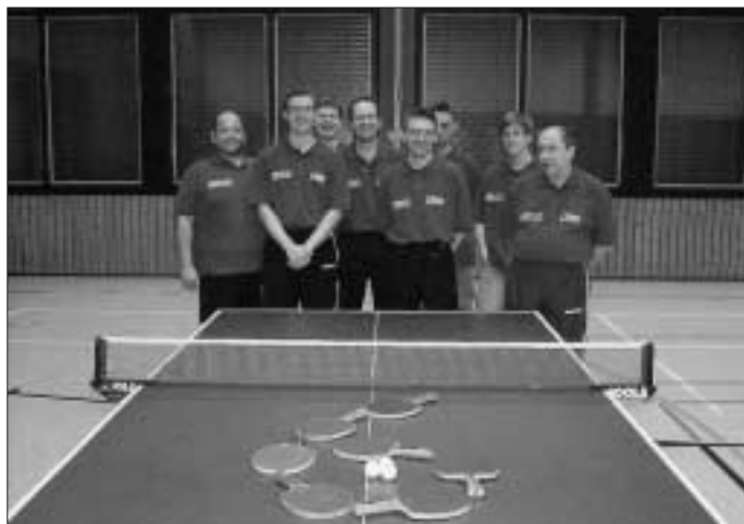
Die Mannschaft des TSV Hirsau I

Der TSV Hirsau I blickt auf eine äußerst erfolgreiche Saison zurück. Nachdem man schon seit einigen Spieltagen als Meister der Kreis- klasse A feststand, konnte auch im letzten Spiel gegen Ottenbronn ein Sieg gefeiert werden. Damit haben die Hirsauer es tatsächlich geschafft, kein einziges Spiel der Saison zu verlieren - es stehen 14 Siege und 4 Unentschieden zu Buche.