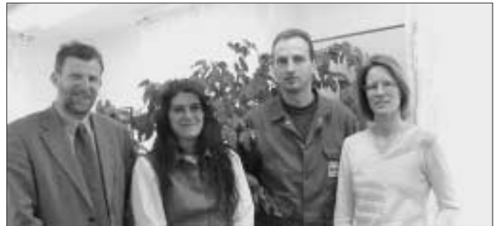
Finanzielle Unterstützung wird dem Förderverein zuteil.