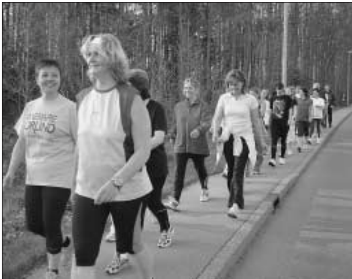
Laufen mit Gehpause

Wiedereinsteiger gibt es jedes Jahr zum Anfängerkurs, das sind die Läufer die man über den Winter nicht nach draußen locken kann, hier gibt es eine neue Chance am Ball zu bleiben. Die Motivation der Läufer ist so unterschiedlich wie die Gruppe selbst. Vom Jugendlichen bis zur Altersgruppe "über 40" ist alles vertreten, dennoch überwiegt der Frauenanteil beträchtlich.