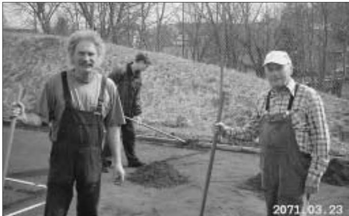
Alle helfen mit

Arbeitseinsätze am 15.4.06 sowie am 22.4.06.