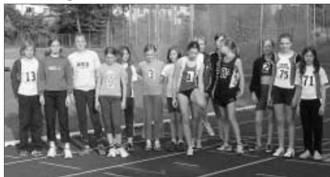
Start Schülerinnen 800 m