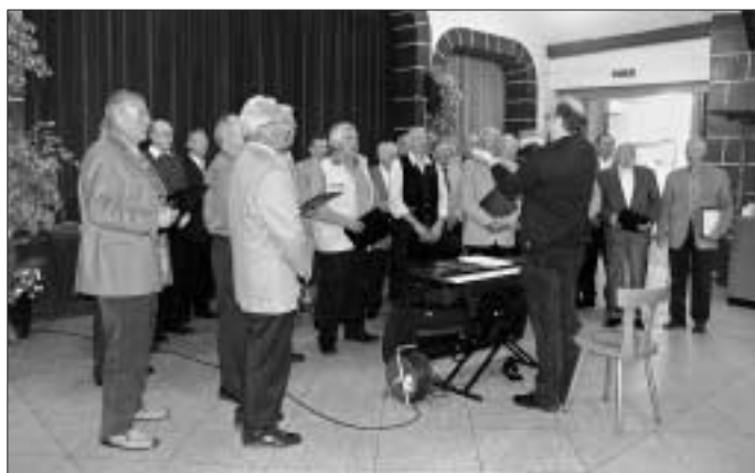
Unsere Enkircher Freunde beim gemeinsamen Abend, 20. Mai