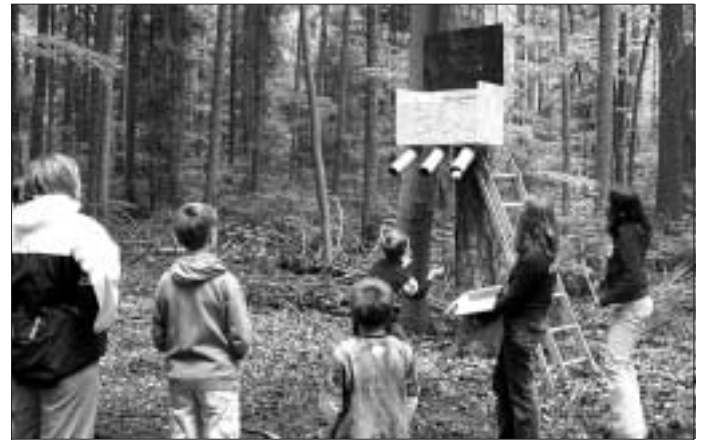
Wo kommt der Ball?

nahmen 56 Kinder, in 2er- und 3er-Teams teil. Sie starteten mit einer Wegbeschreibung und 16 Fragen, die unterwegs beantwortet werden sollten. Außerdem konnten sie an 5 Stationen bei verschiedenen Geschicklichkeitsübungen ihr Können zeigen. Am reinen Geschicklichkeitsparcours, der für die kleineren Kinder gedacht war nahmen weitere 20 Kinder teil. Alle Kinder bekamen an der letzten Station ein Eis. Wieder an der Halle angekommen durften sie sich an den aufgebauten Sportgeräten und auf der Air-Track-Matte so richtig austoben, bis sie um kurz nach 5 Uhr bei der Siegerehrung ihre Urkunde und ein kleines Geschenk erhielten.