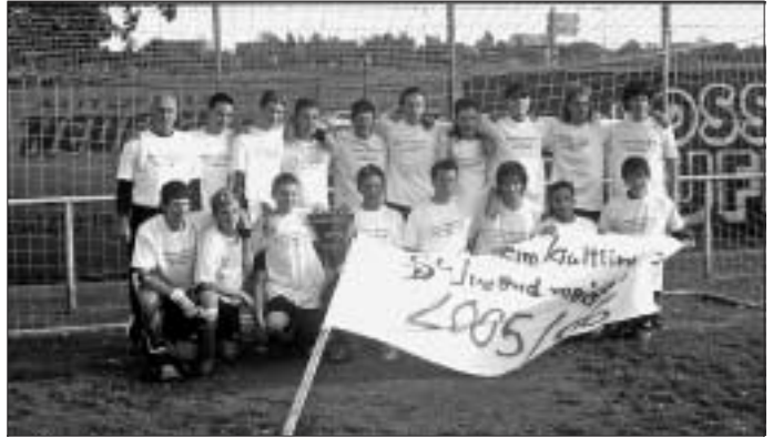
B-Jgd. Meister der Leistungsstaffel und Aufsteiger in die Bezirksstaffel

Mit einem 1:0-Erfolg über Weil der Stadt stand am Nachmittag der Turniersieger fest.