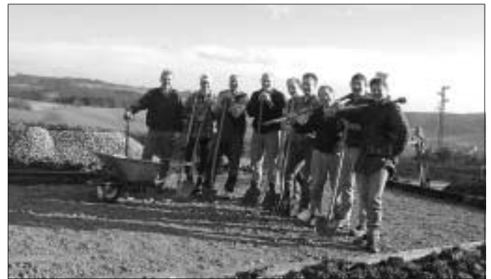
Kräftige Hände am Bau !

Kulinarisch werden wir durch ein knuspriges Spanferkel sowie verschiedene Beilagen bestens bei Laune gehalten. Damit wir dies besser planen können, bitten wir um eine Rückmeldung über euer geplantes Kommen.