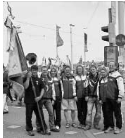
Abschluss des Turnfestes auf dem Festumzug

Rund 20.000 Teilnehmer, davon 16.000 angemeldete Wettkampfteilnehmer, feierten von 24. bis 28.05. in Heidelberg auf dem gemeinsamen Turnfest des Badischen und Schwäbischen Turnerbundes. Und wir waren dabei! 25 Mitglieder vom TVA reisten letzte Woche nach Heidelberg - zwei von uns sind sogar mit dem Fahrrad hingefahren - und erlebten ein tolles Turnfest: Auf den 4 Bühnen am Karlsplatz, am Marktplatz, am Uni-Platz und auf der SWR 1 Bühne auf der Neckarwiese waren zahlreiche Showvorführungen und Bands zu sehen und zu hören, es gab die Turnfestgala, die Turnfestwanderung, diverse Fitness- und Mitmachangebote, und vieles mehr. Darüber hinaus war Heidelberg mit der schönen Altstadt und dem Schloss für sich allein schon eine Reise wert.