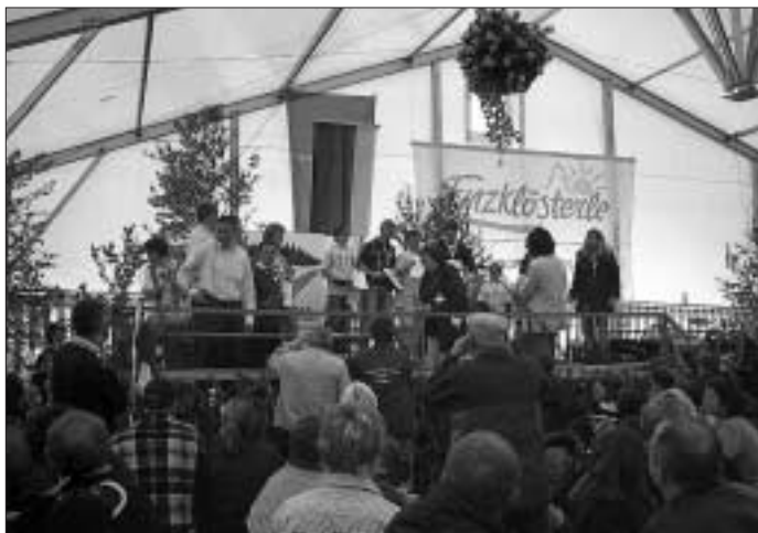
1. Jugend - Europameister 2006 im Sensenmähen

Die "Jungen Schärhaufenköpfer" belegten in der A-Klasse mit nur 4 sec. Rückstand den 4. Platz, was bei einer Gesamtbesetzung von 25 Mannschaften eine hervorragende Leistung ist. Leider hat es bei den Profis nicht gereicht, aber es gilt immer der olympische Gedanke, "dabei sein ist alles".