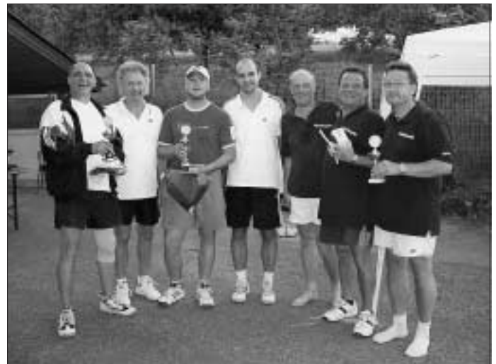
Das hat Spaß gemacht!!