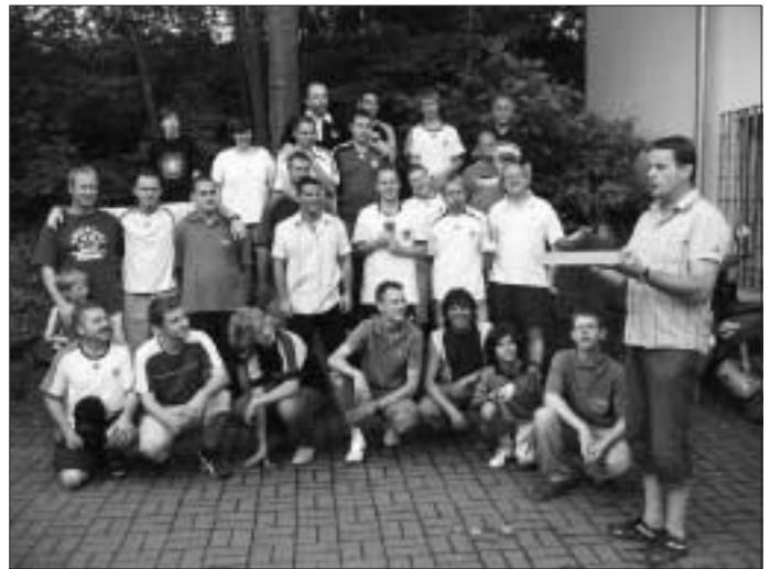
Die Stammheimer und Gechingener Spieler trennten sich 2:2. Da es keinen Verlierer gibt, bleibt der Wanderpokal in Stammheim.

Beim anschließenden Grillen tat auch der einsetzende Regen der guten Laune und dem gemütlichen Beisammensein keinen Abbruch. Einige Gechingener Musiker ließen es sich nicht nehmen, mit uns gemeinsam das "Kleine WM-Finale" im Vereinsheim anzuschauen.