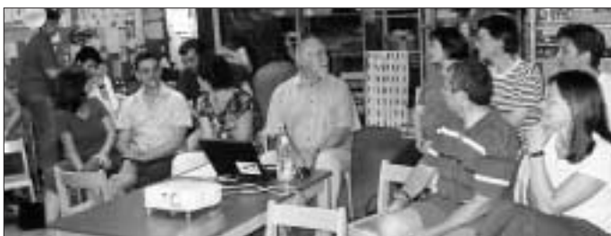
Interessante Einblicke für die Kleinen