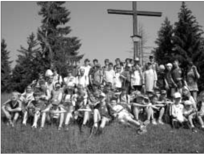
Die FC A/W Jugend auf dem Gipfel