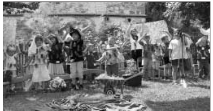
Mit einer etwas anderen Art der "Vogelhochzeit" feierten die Kinder des Kindergartens Klosterhof ein ausgelassenes Sommerfest

Und weil so ein Kücken nun mal recht schnell flügge wird, neugierig seine Umwelt erkundet und schließlich von dannen zieht, fiel es den Erzieherinnen nach der Aufführung auch nicht schwer, mit etwas Wehmut den Bogen zu den Kindern zu schlagen, die bald dem Kindergarten den Rücken kehren und nach den Sommerferien ihren ersten Schultag feiern werden. Für diese Kinder wurde das Sommerfest damit gleichzeitig zu einer gelungenen Abschlussfeier im Kreis ihrer Eltern und Freunde, die mit einem originellen Bastelangebot und allerlei süßen Häppchen abgerundet wurde.