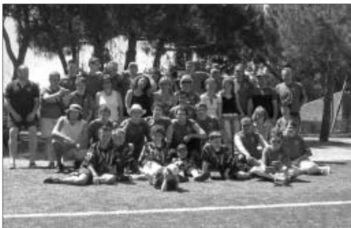
Die FC A/W Spanienfahrer im Stadion von Pineda del Mar

Am Sonntag, den 23. Juli um 16 Uhr findet im Stadion auf dem Wimberg das erste Vorbereitungsspiel der Aktiven gegen den SV Pfrondorf/Mindersbach statt.