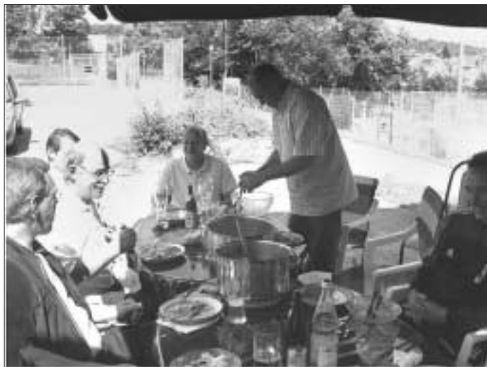
Geselligkeit gehört zum Sport dazu

Wir freuen uns jetzt schon auf gute und interessante Spiele bei hoffentlich deutlich besserem Wetter.