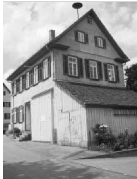
Altes Rathaus Alzenberg

Am 21. 08.2006 fanden sich 40 interessierte Alt- und Neualzenberger am Erhalt des Alten Rathauses in dessen Saal ein. Nach einer kurzen Begrüßung wurde ein Rundgang durch das Alte Rathaus gestartet, damit sich jeder ein eigenes Bild über das Gebäude machen konnte. Das Alte Rathaus ist in vielen Bereichen noch im Originalzustand aus dem Jahr 1880. In den 50er Jahren wurden die Fenster erneuert und verschiedene Einbauten vorgenommen.