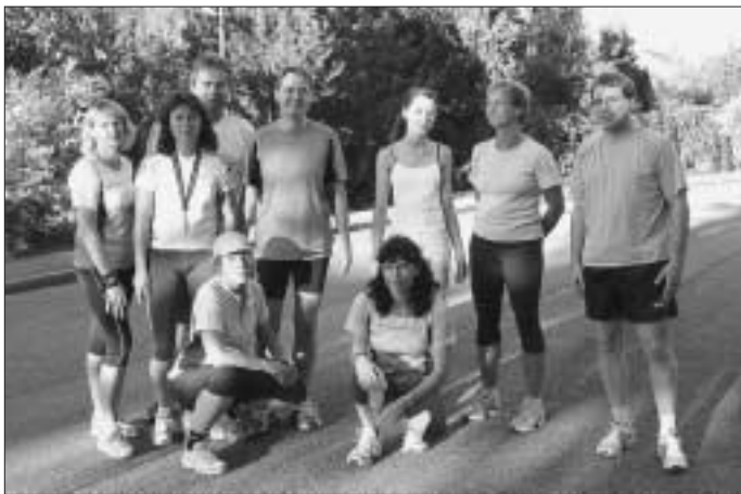
Sie wollen es wagen

Bereits zum 12. Mal treffen sich Läufer aus der Umgebung zum traditionellen Volkslauf in Altburg. Diese kommen nicht nur wegen des vielgerühmten Kuchenbuffets, sondern auch wegen der schönen und schnellen Laufstrecke über Weltenschwann und Speßhardt. Wie immer werden die Bambinis als erste ins Rennen geschickt, dieses Jahr aber erst um 14.15 Uhr. Um 15.30 Uhr startet dann das Hauptfeld über 5 und 10 Kilometer. Die Altburger Bevölkerung ist herzlich eingeladen.