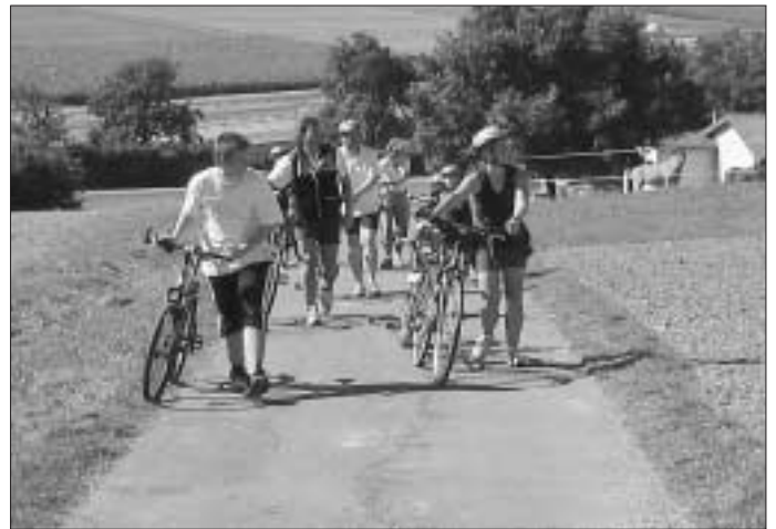
... und gelegentlich per pedes ...

Die Radler wurden nicht enttäuscht und anschließend köstlich verwöhnt. In der Hoffnung auf etwas regere Teilnahme im nächsten Jahr endete ein schöner Ausflug.