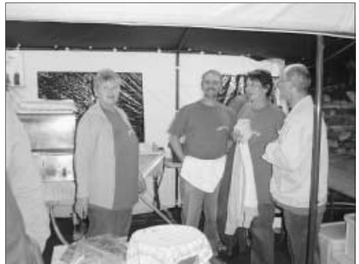
Dorfplatzfest Holzbronn August 2006

Liebe Liederkränzler, Passive, Aktive, Freunde, Familienangehörige,