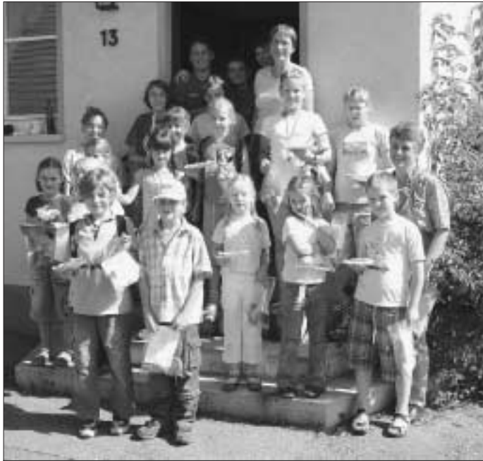
Nach getaner Arbeit vor dem Backhaus

Der Obst- und Gartenbauverein Holzbronn bot für das diesjährige Kinderferienprogramm erstmalig "Backen im Holzbackhaus" an. Die Resonanz war so groß, dass gar nicht alle Anmeldungen berücksichtigt werden konnten.