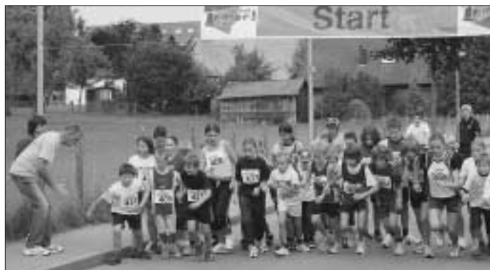
Schüler beim Start

Lauf (1000 Meter); 14.30 Uhr Schülerlauf (2000 Meter); 15.30 Uhr Jedermann- und Schülerlauf (5000 Meter) und Hauptlauf (10000 Meter). Weitere Informationen unter www.taltburg.de