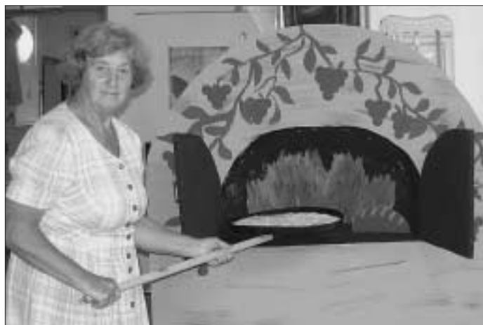
Backhaus im Speisesaal

und Flammkuchen gebacken. Dazu wurde Traubensaft gereicht und auf dem Akkordeon bekannte Lieder gespielt, die die Senioren zum Mitsingen anregten.