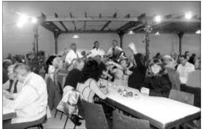
Singen macht Laune!