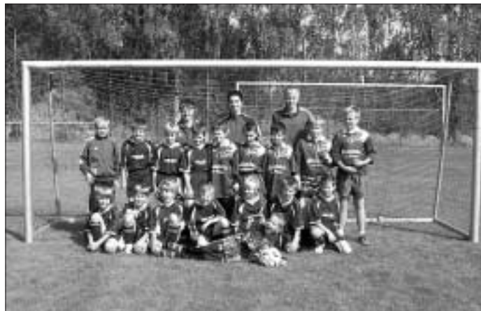
FC A/W E-Jugend

Sonstiges: Einer für alle, alle für einen!