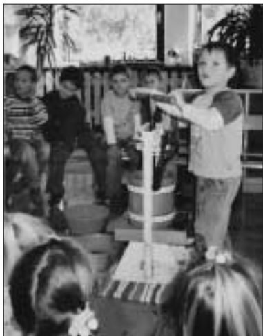
Besuch bei der Mosterei

Oder: in einem Apfel versteckt sich außer manchem Würmchen noch vieles mehr, z.B. Apfelkerne, Fruchtfleisch und ganz viel Apfelsaft.