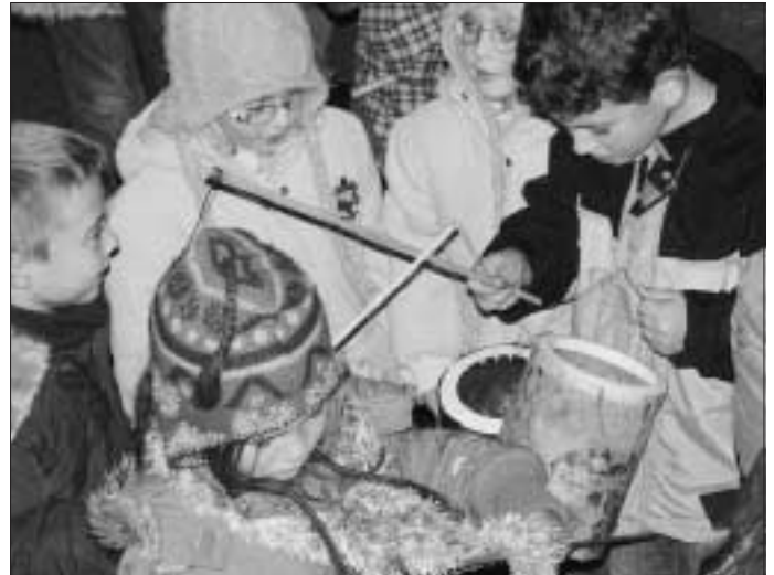
Mit Lampions Licht in die Nacht gebracht

langsam wieder in viele einzelne, bunte Lichtpunkte auf, die noch einige Zeit durch die Straßen und Gassen Hirsaus flackerten.