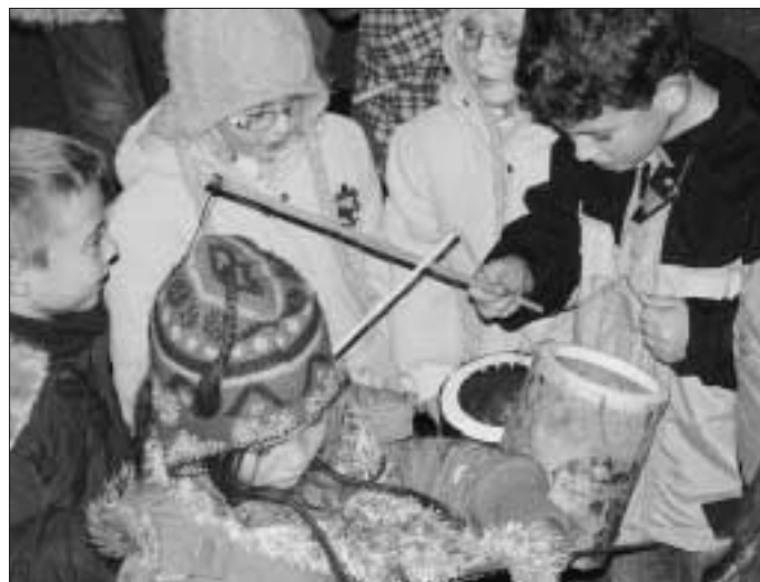
Mit Lampions Licht in die Nacht gebracht

langsam wieder in viele einzelne, bunte Lichtpunkte auf, die noch einige Zeit durch die Straßen und Gassen Hirsaus flackerten.