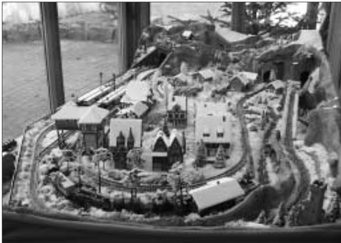
Das Fenster vom 4.12.2006

Freitag, 15.12. Kindergarten WeSpe, Schulhaus Weltenschwann/Speßhardt