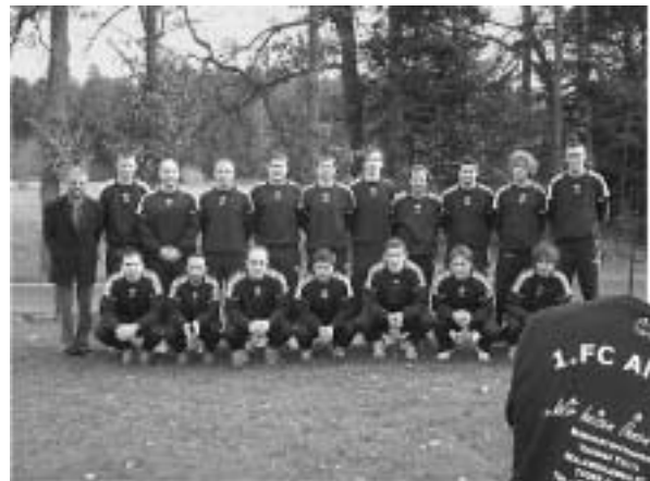
Die Spieler präsentieren ihre neuen Trainingspullover

So, 10.12.2006 14.30 Uhr: Zrinski Calw - F C Altburg II