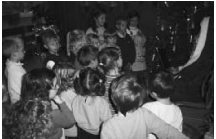
Was er wohl zu sagen hatte ?

In der Winterpause nimmt unsere Elf an Hallenturnieren in Neubulach, Empfingen, Stammheim und Gechingen teil. Der Zeitpunkt der jeweiligen Turniere wird rechtzeitig bekanntgegeben.