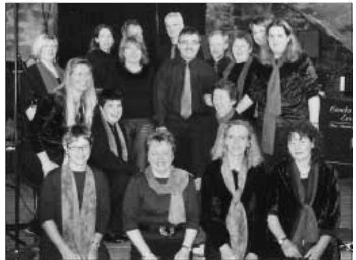
Fortissimo bedankt sich für 10 Jahre Treue