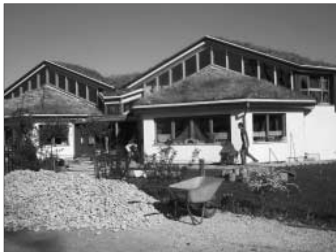
Fleißige Eltern bauen mit

Mit vereinten Kräften, starker Verpflegung und einer großen Portion guter Laune konnte dieses Projekt an nur einem Tag fertig gestellt werden!