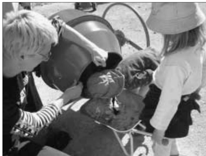
Fleißige Bauarbeiterinnen am Betonmischer

Um die Basteleien für den bevorstehenden Muttertag zu bearbeiten, mussten die Wurzelkinder in der vergangenen Woche "umziehen" - wenn auch nur für einen Tag. Ziel des Umzugs war der Reuttersche Garten in Holzbronn. Denn hier gab es den so wichtigen Betonmischer und den dazugehörigen Stromanschluss. Zuerst wurden nun Fliesen mit dem Hammer zertrümmert, dann mit einer Portion Kies in den Betonmischer gefüllt und ... dann hieß es abwarten. Nach geraumer Zeit waren die Kanten der Fliesenstückchen relativ glatt geschmirgelt, sodass einmal ausleeren - einmal neu füllen auf dem Programm stand. So ging das den ganzen Vormittag.