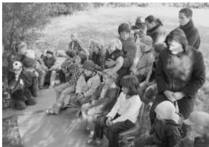
Aufmerksame Zuhörer bei der Michaeli-Geschichte