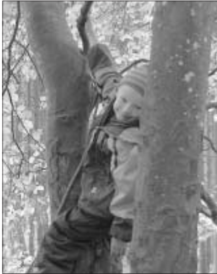
Die Wurzelkinder klettern mit großer Begeisterung auf und in den Bäumen...

verhalten hat (nicht in die Werkbank, sondern in das Holzstück sägen, die anderen Kinder nicht bedrängen, immer nur ein Werkzeug zur selben Zeit nehmen etc.). Jedem Wurzelkind wurde die Einweisung an der Werkbank schriftlich bescheinigt, die Kinder signierten stolz mit der eigenen Unterschrift und nun sind alle berechtigt, nach Lust und Laune zu arbeiten. Wir sind gespannt auf die Fertigungen, die die Kinder mit nach Hause bringen werden!