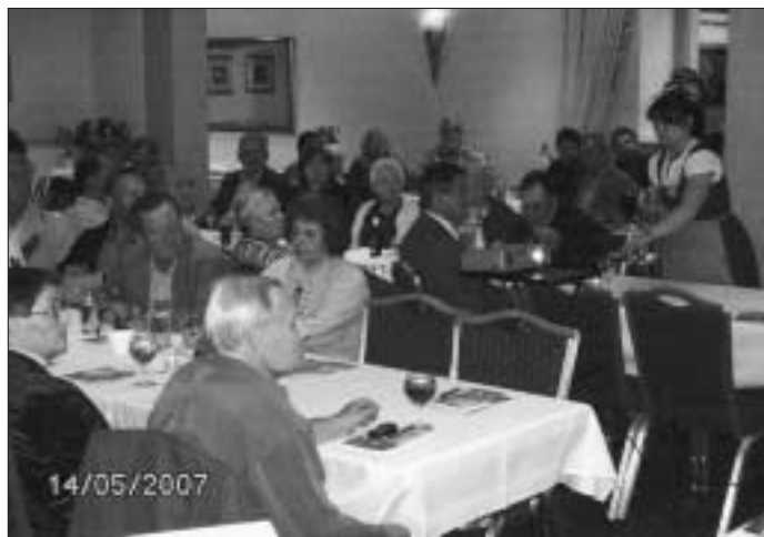
Teilnehmer der Mitgliederversammlung