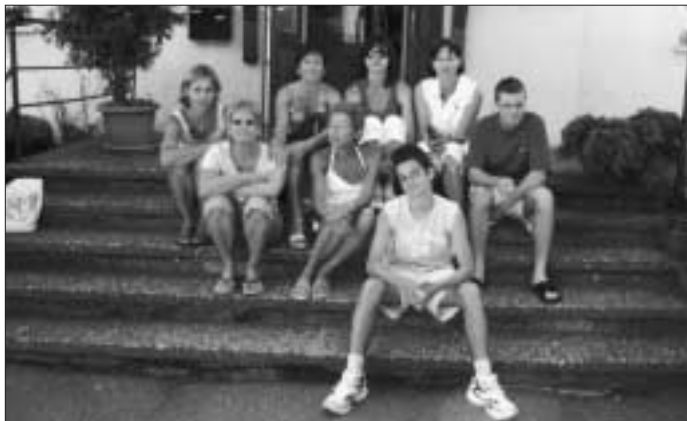
Die Platzierten des Clubturniers 2007

Vortrag abgesagt, allerdings verbunden mit der Hoffnung, Sie eventuell zu einem späteren Termin noch nachholen zu können.