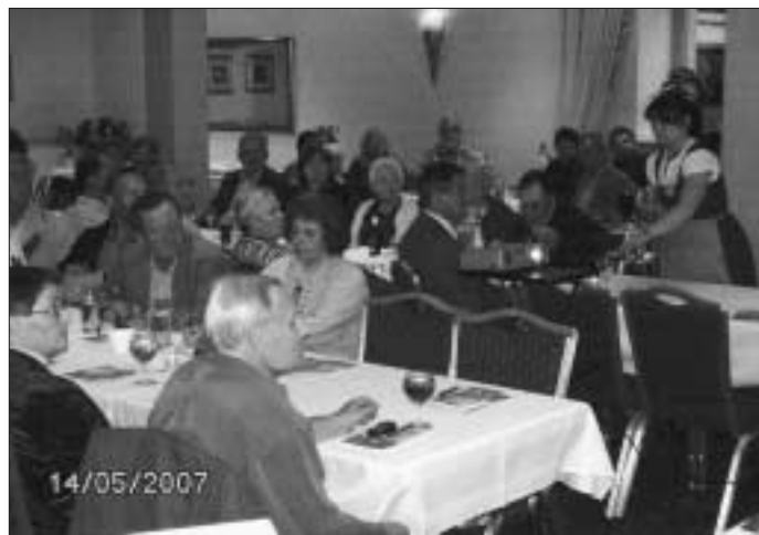
Teilnehmer der Mitgliederversammlung