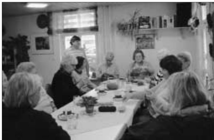
Starkes Echo fand die Einladung zum ersten Treffen des Strickkreises.