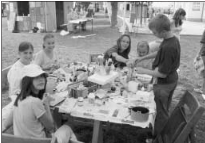
MitarbeiterInnen der Kunstgalerie bei der Arbeit

Ein besonderer Dank auch an die Stadtverwaltung Calw für die tolle Unterstützung und last but not least an alle Mütter und Väter, die uns jeden Tag mit Materialien und leckeren Kuchen unterstützt haben!