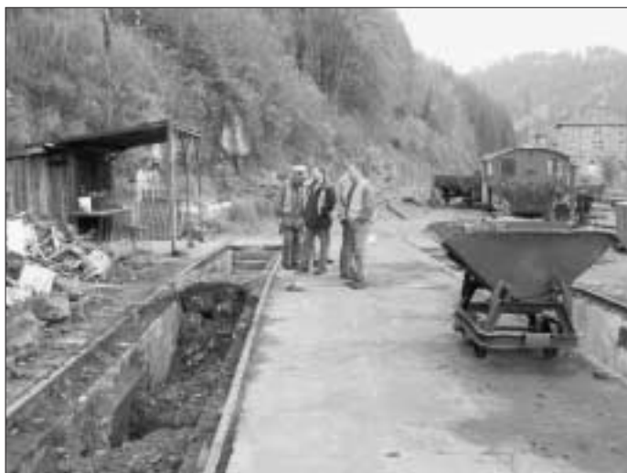
"Ausgrabungen": Auch die Untersuchungsgrube des ehemaligen Lokomotivschuppens kommt wieder zum Vorschein

Öffentliche Vorstandssitzung jeden 1. Mittwoch im Monat, Mai - Oktober, 19 Uhr, Eisenbahnwagen am Bahnhof Althengstett. Arbeitseinsätze ganzjährig jeden Samstag, Info bei Jürgen Espenhain, Tel. 0 70 51 / 3 04 44. www.schwarzwaldbahn-calw.de