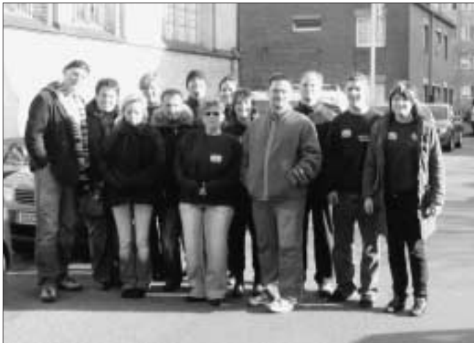
Gruppenbild in Köln

Trollball der Madersheer Zäpflestroll Wimsheim / Radsporthalle