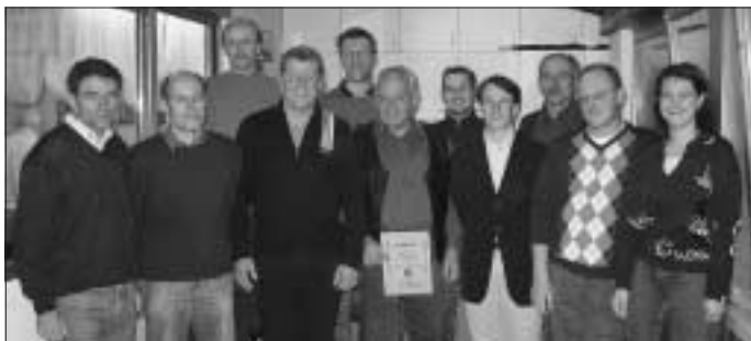
Alte und neue Vorstandschaft

Selbst am Tag der Hauptversammlung war noch nicht ganz klar, wer sein Nachfolger werden könnte.