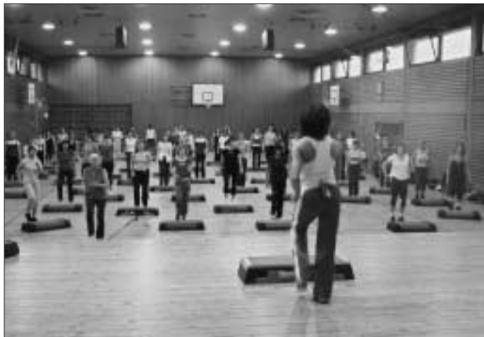
Die Halle bebte bei der 1. Altburger-Aerobic-Convention.