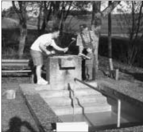
Unterstützung durch den Nachwuchs

Rechtzeitig zum Beginn der Kneipp-Saison hat der OGV Holzbronn die Wassertretanlage gründlich gereinigt, mit Haftgrund versehen und neu gestrichen. Durch die tatkräftige Unterstützung unserer "Jüngsten" (siehe Bild) war die Arbeit schneller als geplant erledigt. Die Inbetriebnahme erfolgt in den nächsten Tagen durch die Stadtwerke Calw.