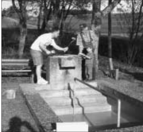
Unterstützung durch den Nachwuchs

Rechtzeitig zum Beginn der Kneipp-Saison hat der OGV Holzbronn die Wassertretanlage gründlich gereinigt, mit Haftgrund versehen und neu gestrichen. Durch die tatkräftige Unterstützung unserer "Jüngsten" (siehe Bild) war die Arbeit schneller als geplant erledigt. Die Inbetriebnahme erfolgt in den nächsten Tagen durch die Stadtwerke Calw.