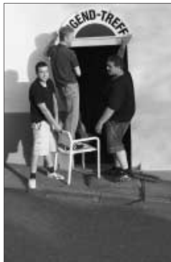
men at work

Seit vergangener Woche ist nun auch nach außen hin sichtbar, was sich hinter den Mauern des Stundenhäusle verbirgt. Mit vereinten Kräften wurde ein Schild mit der Aufschrift "Jugendtreff" angebracht. Es soll gleichzeitig eine Einladung an alle Jugendlichen sein. Kommt einfach vorbei, bringt ein paar Freundinnen oder Freunde mit und schaut euch ganz unverbindlich um. Der Jugendtreff ist montags und mittwochs von 18 bis 21:30 Uhr geöffnet.