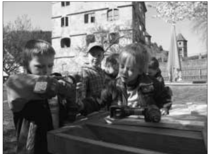
Werken im Kindergarten Klosterhof