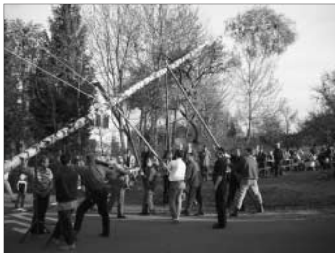
Aufstellen des Maibaumes

Am Abend des 30. April gegen 17.00 Uhr wird die Freiwillige Feuerwehr Calw, Löschgruppe Alzenberg, beim Gerätehaus in Alzenberg einen Maibaum aufstellen.