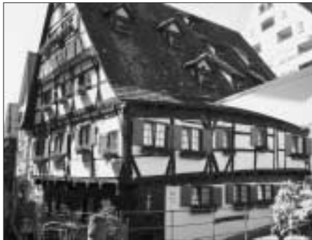
Das Hotel "Schiefes Haus" in Ulm hat alle erstaunt

Der Männerchor trifft sich heute, Freitag, 25. Mai, der Gemischte Chor erst wieder am Dienstag, 12. Juni.