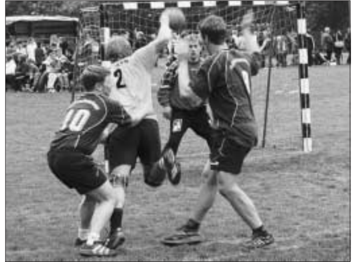
Spiel, Spaß und Spannung

kosten, Hallenkosten etc. bestreiten. Besten Dank für Ihr Verständnis. Nun hoffen wir auf schönes Wetter, spannende Spiele und zahlreiche Besucher aus nah und fern. TSV Hirsau- Abteilung Handball und Förderverein für den Handballsport im TSV Hirsau