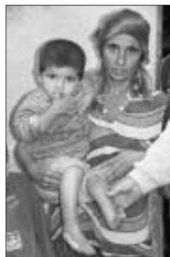
Florica + Kind

Die Annahmestelle für Hilfsgüter in der Calwer Deckenfabrik ist samstags, 10 - 13 Uhr geöffnet.