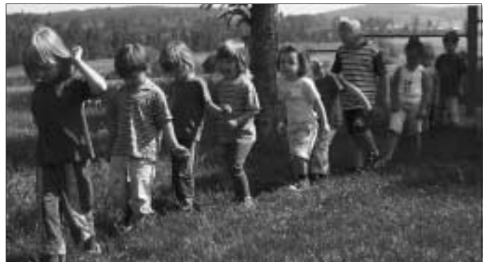
Spiel mit Spannung