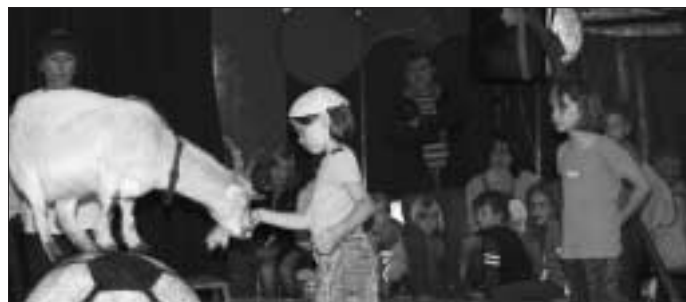
Kinder im Zirkuszelt

ihren Späßen die Lacher immer auf ihrer Seite hatten. Der Stadtteilbeirat Heumaden freut sich über den großen Erfolg und wird auch in den nächsten Pfingstferien den Zirkus-Workshop wieder anbieten.