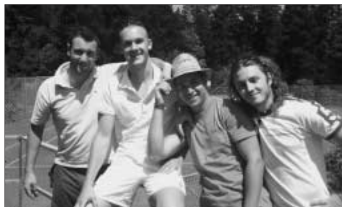
Die 1. Herrenmannschaft des TCA

Sämtliche Mannschaften des TCA die am vergangenen Wochenende im Einsatz waren, konnten teilweise deutliche Siege erringen. Die Junioren gewannen ihr erstes Spiel gegen die Spg Weil der Stadt mit 5:3. Ihren dritten Sieg in Folge konnte die Damenmannschaft in der Verbandsliga einfahren. Diesmal gewannen sie beim TC Weiler zum Stein mit 7:2. Die Herren 50 besiegten die Mannschaft der TA Gechingen auf deren Anlage mit 7:2 und "die ganz Alten" (Herren 60) schafften einen sicheren 7:1 Sieg in Nagold. Die 1. Herrenmannschaft gewann ungeschlagen mit 8:0 Punkten gegen eine Mannschaft der TA TSG Leonberg.