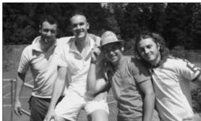
Die 1. Herrenmannschaft des TCA

Sämtliche Mannschaften des TCA die am vergangenen Wochenende im Einsatz waren, konnten teilweise deutliche Siege erringen. Die Junioren gewannen ihr erstes Spiel gegen die Spg Weil der Stadt mit 5:3. Ihren dritten Sieg in Folge konnte die Damenmannschaft in der Verbandsliga einfahren. Diesmal gewannen sie beim TC Weiler zum Stein mit 7:2. Die Herren 50 besiegten die Mannschaft der TA Gechingen auf deren Anlage mit 7:2 und "die ganz Alten" (Herren 60) schafften einen sicheren 7:1 Sieg in Nagold. Die 1. Herrenmannschaft gewann ungeschlagen mit 8:0 Punkten gegen eine Mannschaft der TA TSG Leonberg.