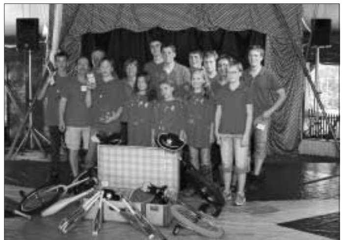
Zirkusgruppe SH-Zelli in Mannheim