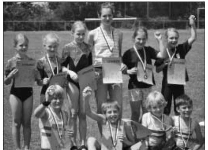
Gelöste Stimmung nach dem Wettkampf. Herzlichen Glückwunsch zu euren Leistungen!

Die Turnerinnen und Turner waren zum sogenannten "Deutschen 6-Kampf" angetreten. Zu diesem Wettkampf gehören die Geräte Boden, Sprung und Stufenbarren (weiblich) oder Reck (männlich) und die Leichtathletikdisziplinen Lauf, Weitsprung und je nach Alter Kugelstoßen oder Ballwurf. Die Wettkämpfe fanden in der kleinen Eichwaldhalle und auf dem Sportplatz statt.