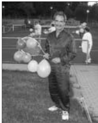
Germanys next Topmodell

Eine außergewöhnliche Modenschau feinsten Schlafgewänder fand am vergangenen Samstagabend in Holzbronn statt. Zu dem aus Wettergründen kurzfristig verschobenen Modeereignis - Pyja-