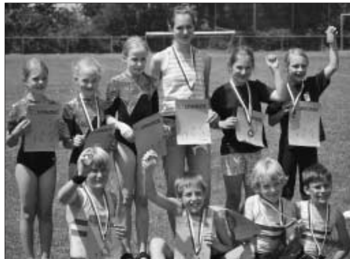
Gelöste Stimmung nach dem Wettkampf. Herzlichen Glückwunsch zu euren Leistungen!

Die Turnerinnen und Turner waren zum sogenannten "Deutschen 6-Kampf" angetreten. Zu diesem Wettkampf gehören die Geräte Boden, Sprung und Stufenbarren (weiblich) oder Reck (männlich) und die Leichtathletikdisziplinen Lauf, Weitsprung und je nach Alter Kugelstoßen oder Ballwurf. Die Wettkämpfe fanden in der kleinen Eichwaldhalle und auf dem Sportplatz statt.