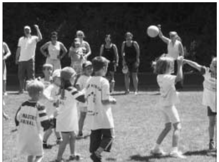
Früh übt sich...