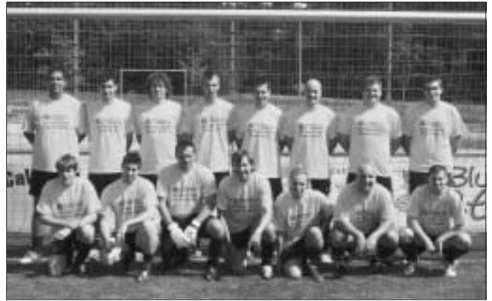
Der 1. FC Altburg II mit seinen neuen "Warmmachtrikots" gesponsert vom "SV Team Calw Armin Kober"