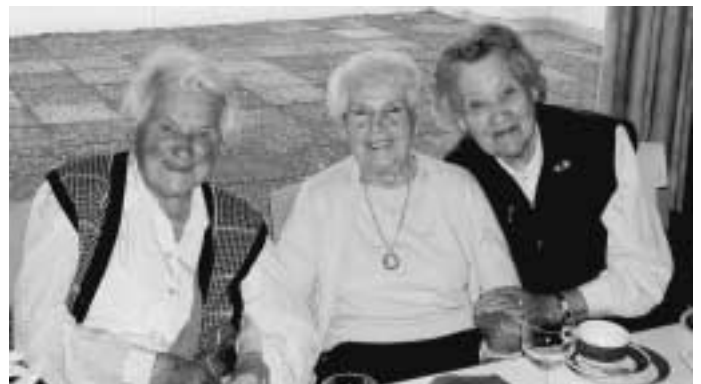
Die Besucher des Seniorenachmittags der Kath. Kirchengemeinde erlebten einen geselligen Nachmittag