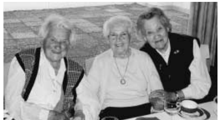
Die Besucher des Seniorenachmittags der Kath. Kirchengemeinde erlebten einen geselligen Nachmittag