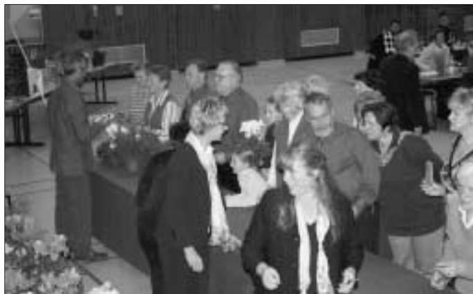
Blumenausgabe beim Herbstfest

Die Zusammenkunft der Reisetilnehmer und Interessierten findet am Sonntag, 18. November ab 18 Uhr im Vereinsheim der Stammheimer Kleintierzüchter (Schafscheuer) statt. Um unsere Reise 2007 zur "Mecklenburger Seenplatte" Revue passieren zu lassen. Im Anschluss daran stellen wir unsere Reise 2008 vor, die vom 11. bis 14. Juni 2008 stattfindet. Wir freuen uns auf interessierte Gäste, Freunde, Reisetilnehmer und Mitglieder des Vereins!