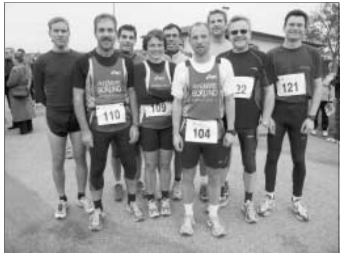
Das Altburger Team beim Waldenser-Lauf