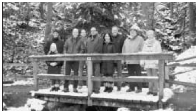
Unser Bild zeigt einige Mitglieder bei der Begehung des Calwer Stadtgarten.

Bei einer Waldbegehung wurde die "Schatztruhe vor der Haustüre" besichtigt und eine erste Konzeption erörtert. Diese sieht vor, den einstigen Waldlehrpfad in leicht geänderter Form wiederherzustellen. Hinzu soll eine Ergänzung aus Geschichts-, Kultur- und Geologie- Lehrpfäden ein Bestandteil dieser Attraktion werden. Ein Schwerpunkt soll hierbei vor allem auf die Kinderfreundlichkeit (spielendes Lernen) gesetzt werden.